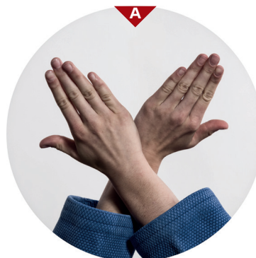
Bild A zeigt dir genau die Haltung der Hände. Die Daumen beider Hände greifen in die Jacke von Uke, die Finger bleiben außen. Die Haltung der Hände ist also „normal“ (nami). Greife mit beiden Händen tief in den Kragen von Uke. Beim Würgen ziehst du die Ellbogen auseinander und drückst mit deinen Handkanten gegen den Hals von Uke.