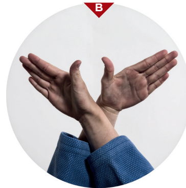
Bild B zeigt dir genau die Haltung der Hände. Beide Handflächen bzw. Daumen zeigen nach oben. Die Position der Hände ist also „verkehrt oder umgekehrt“ (gyaku). Greife ebenfalls mit beiden Händen (Finger innen) tief in Ukes Kragen und würge, indem du beide Ellbogen auseinanderziehst.